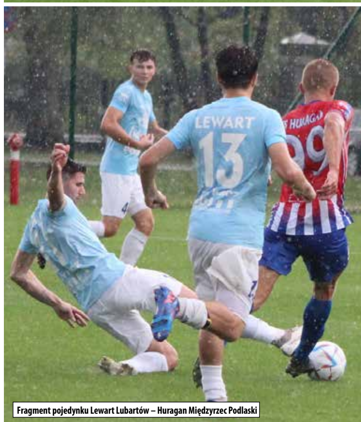
Fragment pojedynku Lewart Lubartów – Huragan Międzyrzec Podlaski