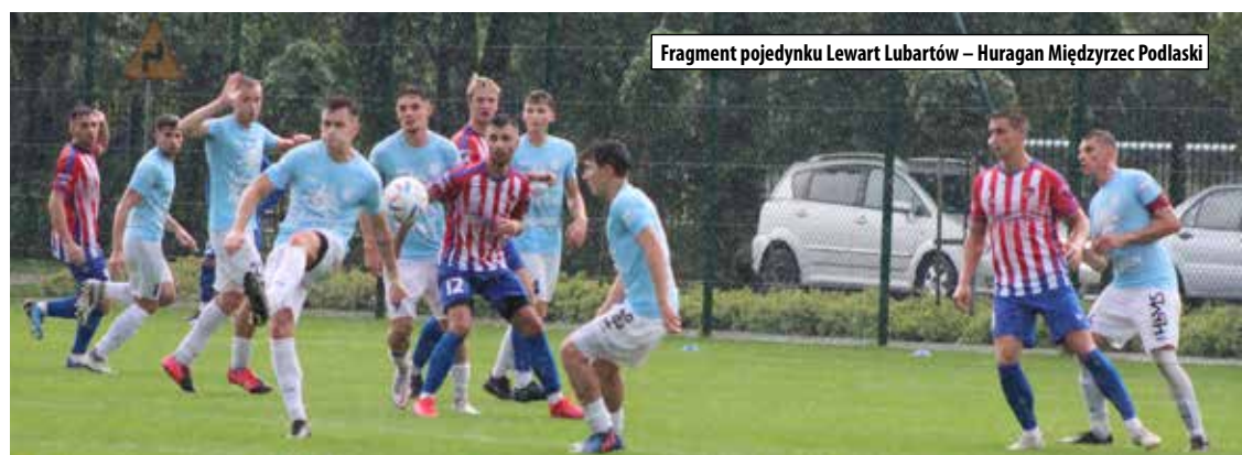
Fragment pojedynku Lewart Lubartów – Huragan Międzyrzec Podlaski