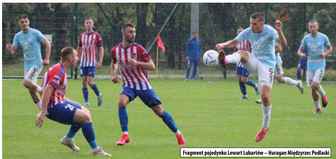
Fragment pojedynku Lewart Lubartów – Huragan Międzyrzec Podlaski