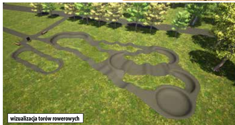
wizualizacja torów rowerowych

Wykonawca inwestycji firma Bt project Eu prowadzi już prace ziemne. Przypominamy, że pumprack będzie mieć minimum 215 metrów, a mini-pumprack co najmniej 40 metrów bieżących pasma jezdni, ze wszystkimi niezbędnymi elementami do funkcjonowania toru: odwodnieniem, ukształtowaniem terenu.