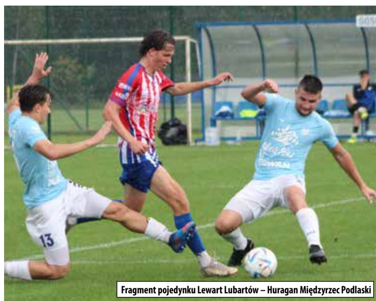
Fragment pojedynku Lewart Lubartów – Huragan Międzyrzec Podlaski

W najbliższy piątek 26 sierpnia, w ramach trzeciej kolejki piłkarze Lewartu zagrają na własnym boisku z Górnikiem II Łęczna. Początek spotkania o godzinie 17.00. Czwarta kolejka zaplanowana jest na weekend 3/4 września. Wtedy to jedenastka z Lubartowa zagra na wyjeździe z Opolaninem Opole Lubelskie. Mecz w niedzielę 4 września rozpocznie się o godzinie 16.00. Tekst i foto: Ireneusz Gózdź