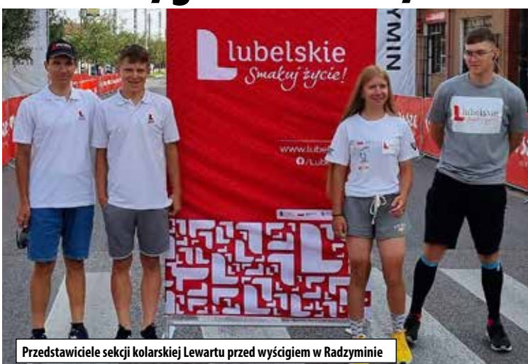
Przedstawiciele sekcji kolarskiej Lewartu przed wyścigiem w Radzyminie