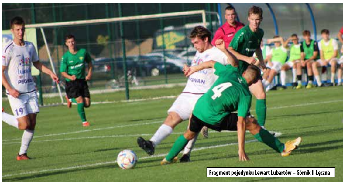
Fragment pojedynku Lewart Lubartów – Górnik II Łęczna