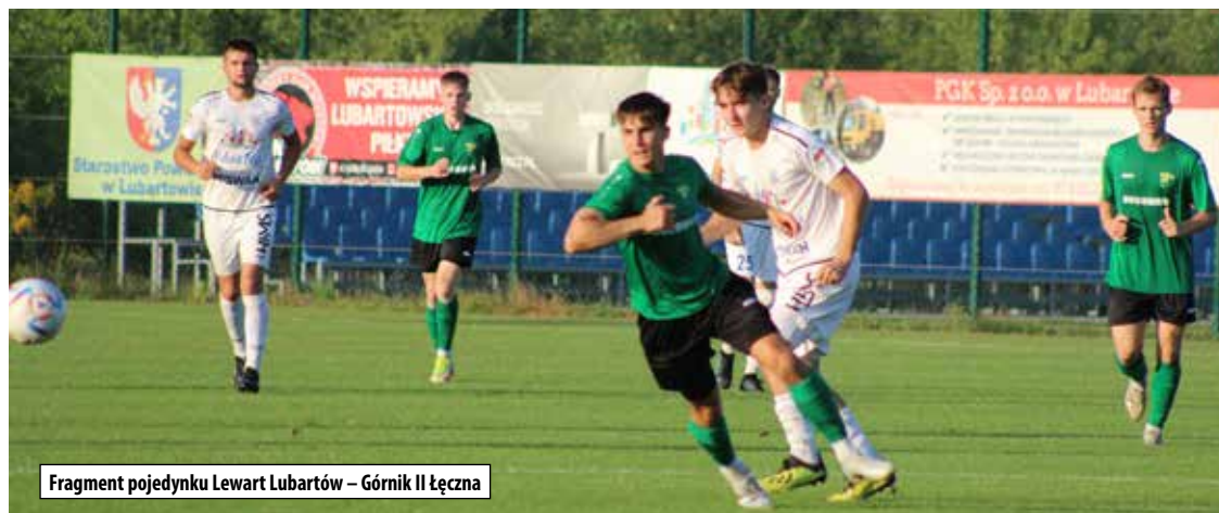
Fragment pojedynku Lewart Lubartów – Górnik II Łęczna