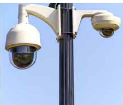
Punkty kamerowe zlokalizowane będą w następujących miejscach:

W Lubartowie pojawią się nowe kamery monitoringu miejskiego. Plac zabaw, siłownie plenerowe, boiska czy pump-track – to miejsca, gdzie będą one dostępne. Właśnie ogłoszony został przetarg na opracowanie dokumentacji projektowej na rozbudowę systemu. Ma być ona kompatybilna z istniejącą już siatką kamer. Termin składania ofert upływa 12 września.