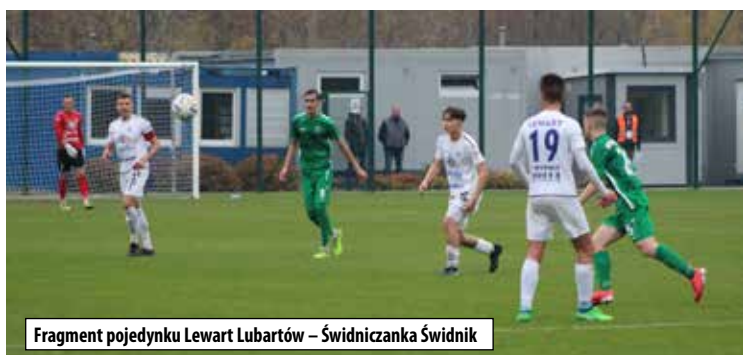
Fragment pojedynku Lewart Lubartów – Świdniczanka Świdnik