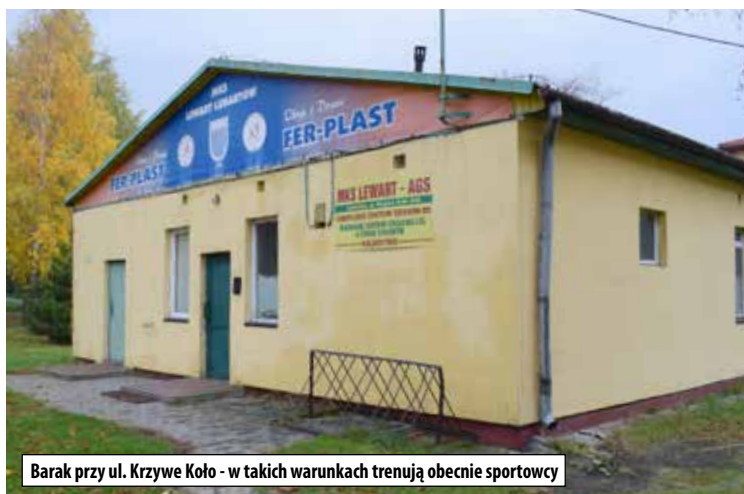
Barak przy ul. Krzywe Koło - w takich warunkach trenują obecnie sportowcy