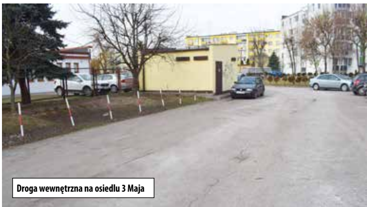
Droga wewnętrzna na osiedlu 3 Maja

Przebudowa ul. 1 Maja na odcinku od ul. Szkolnej do ul. Piaskowej obejmie między innymi roboty ziemne, budowę i przebudowę zjazdów do posesji, wykonanie nowego krawężnika oraz nowej nawierzchni bitumicznej warstwy wiążącej wyrównawczej i warstwy ścieralnej SMA. W ramach zadania zostanie także wykonana regulacja urządzeń odwadniających wpustów i włazów studni oraz przebudowa zatok postojowych.