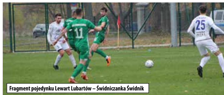
Fragment pojedynku Lewart Lubartów – Świdniczanka Świdnik