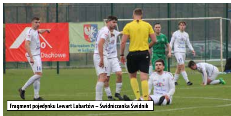
Fragment pojedynku Lewart Lubartów – Świdniczanka Świdnik