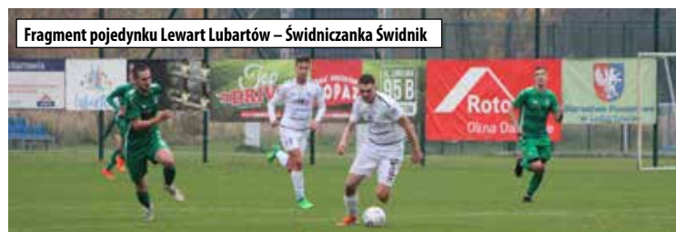
Fragment pojedynku Lewart Lubartów – Świdniczanka Świdnik

Początek rundy rewanżowej dla Lewartu, to spotkania z dwójką najlepszych zespołów. Po porażce z Huraganem nasza drużyna podejmowała na swoim boisku Świdniczkę Świdnik. Przeciwnik to główny kandydat do awansu do III ligi. Przed meczem z Lewartem miał na swoim koncie w tym sezonie 9 zwycięstw i remis.