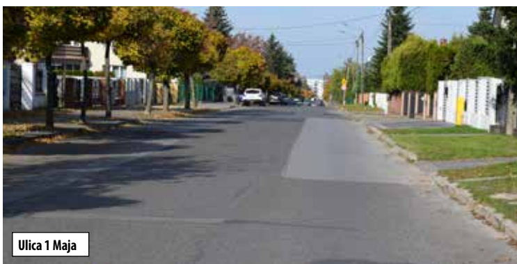
Ulica 1 Maja

Jeśli chodzi o przebudowę drogi wewnętrznej na osiedlu 3 Maja, to zostanie wykonana kanalizacja deszczowa z tunelami rozszarżającymi. Nawierzchnia ma być zrobiona z kostki brukowej. Pojawi się też oznakowanie pionowe i poziome oraz ogrodzenie panelowe zieleni. Na obie oferty przetargowe ratusz czeka do 28 października do godz. 12.00.