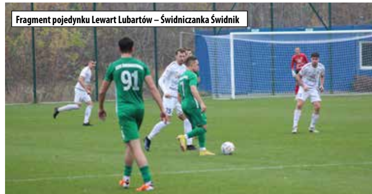
Fragment pojedynku Lewart Lubartów – Świdniczanka Świdnik