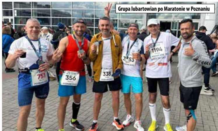
Grupa lubartowian po Maratonie w Poznaniu