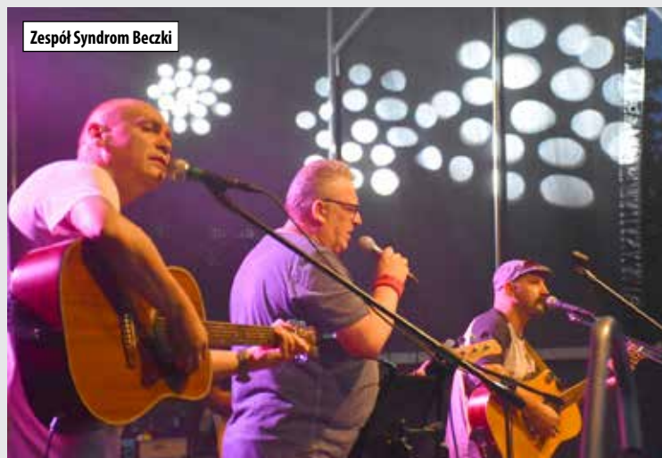
Zespół Syndrom Beczki

- Kiermasz Świąteczny / warsztaty / konkurs dla przedszkolaków – najpiękniejsza choinka, wymień bombkę na gadżety / strefa Św. Mikołaja - LOK