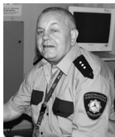
Znajomi, koledzy, przyjaciele

Urodził się w 1946 roku w Lubartowie, gdzie ukończył Szkołę Podstawową. Następnie uczył się w dwuletniej Szkole Rybackiej w Giżycku. Pierwszą pracę podjął w Państwowym Gospodarstwie Rybackim w Ełku, później w takim samym w Siemieniu koło Parczewa. Stąd powołano go do odbycia zasadniczej służby wojskowej. W wojsku służył 6 miesięcy: w 1968 roku założył rodzinę i został zwolniony ze służby. Po powrocie z wojska podjął naukę w Liceum Ogólnokształcącym dla Pracujących im. W. Józwiaka w Lubartowie, które ukończył. Pracował do września 1975 r. Od grudnia podjął pracę w Lubartowskich Zakładach Garbarskich w Lubartowie na stanowisku referenta ds. socjalnych. Od 1985 roku do 2011 roku pracował jako Komendant Straży Pałacowej, później Szef Wewnętrznej Służby Ochrony Muzeum Zamoyskich w Kozłówce. Był zasłużonym i oddanym pracownikiem Muzeum, z którym związany był przez 26 lat. Odnoszony Brązową Odznaką „W Służbie Narodu” w 1984 r., Srebrną Odznaką „Zasłużony Pracownik Przemysłu Lekkiego” w 1985 r., oraz Srebrną Odznaką „Za opiekę nad zabytkami” w 2004 r.