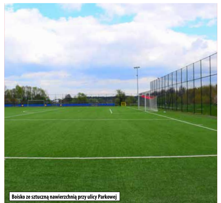
Boisko ze sztuczną nawierzchnią przy ulicy Parkowej

Burmistrz Krzysztof Paśnik podpisał umowę z wykonawcą na dostawę i wymianę 18 opraw oświetlenia ulicznego i parkowego na terenie II LO oraz 80 kloszy halogenowych na oprawy typu LED na lubartowskich boiskach. W związku z tym będzie jasno, nowoczesnie i oszczędnie. Oprawy oświetleniowe będą wymienione w ramach projektu „Rozświetlony Lubartów” i będą: przy