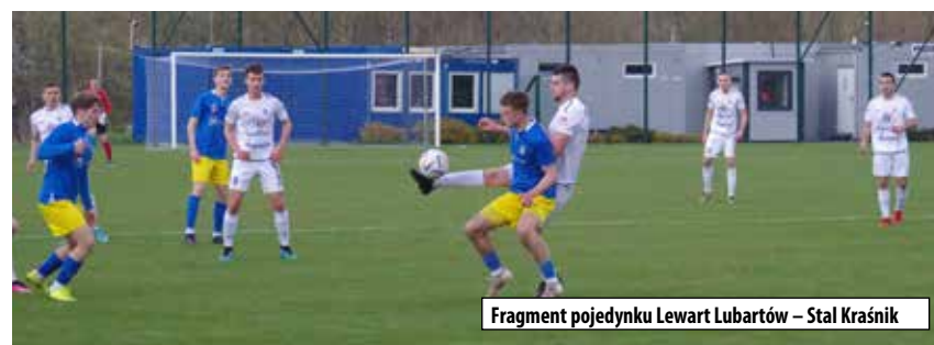
Fragment pojedynku Lewart Lubartów – Stal Kraśnik

W sobotę 1 kwietnia w Terpentynie odbył się III turniej Grand Prix LZS Lubelszczyzny w tenisie stołowym edycji 2023. W imprezie wzięły udział 134 osoby, a patronat nad sportowym spotkaniem sprawował Wójt Gminy Dzierzkowice.