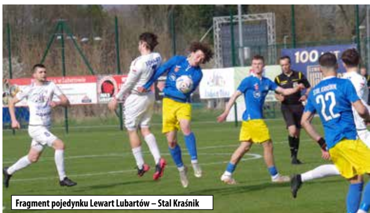
Fragment pojedynku Lewart Lubartów – Stal Kraśnik