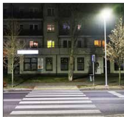
Miasto Lubartów ogłosiło przetarg na „Rozbudowę oświetlenia drogowego drogi bocznej ulicy Żeromskiego, budowę

oświetlenia drogowego drogi bocznej ulicy Krańcowej oraz budowę oświetlenia przejść dla pieszych w Lubartowie”.