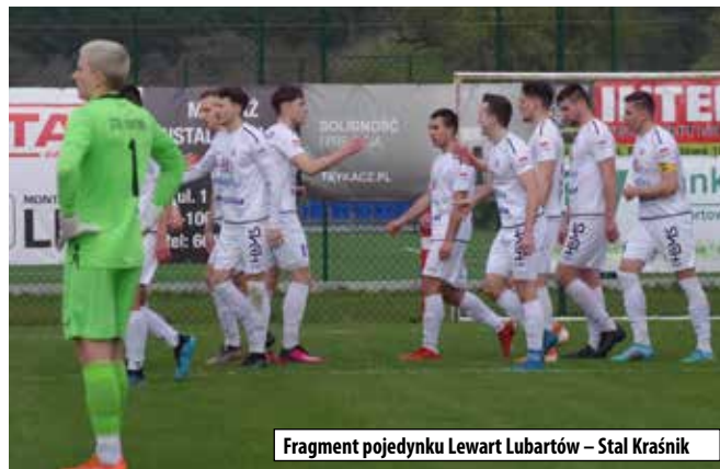
Fragment pojedynku Lewart Lubartów – Stal Kraśnik

ny rozpoczęcia poszczególnych spotkań w grupie mistrzowskiej podczas wiosennej części rozgrywek: