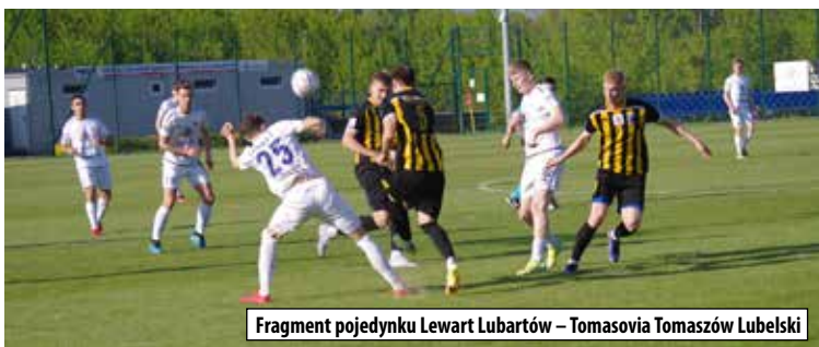
Fragment pojedynku Lewart Lubartów – Tomasovia Tomaszów Lubelski