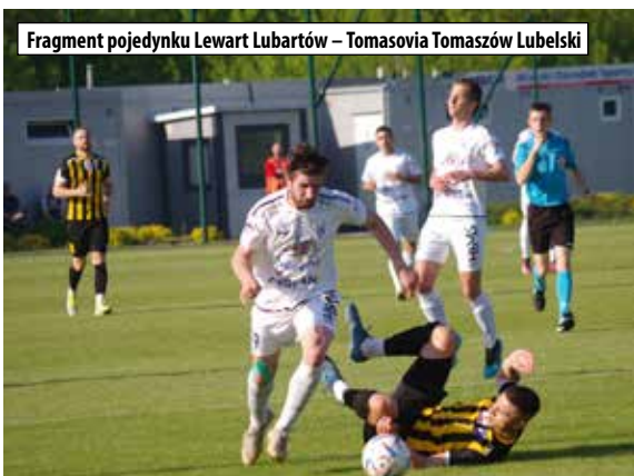
Fragment pojedynku Lewart Lubartów – Tomasovia Tomaszów Lubelski