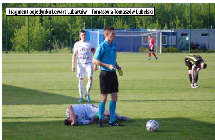
Fragment pojedynku Lewart Lubartów – Tomasovia Tomaszów Lubelski

W najbliższy piątek 26 maja, w ramach siódmej kolejki grupy mistrzowskiej piłkarze Lewartu zagrają na własnym boisku z dru-