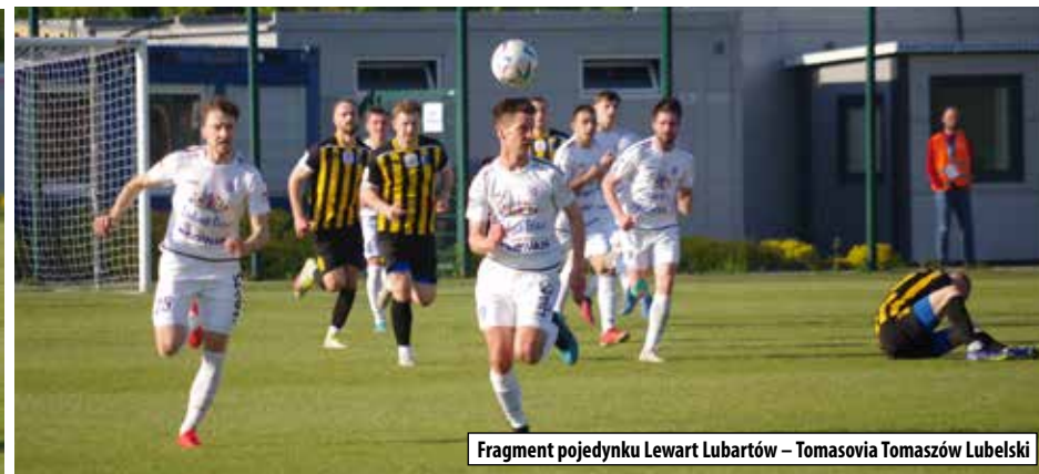
Fragment pojedynku Lewart Lubartów – Tomasovia Tomaszów Lubelski

Jak już informowaliśmy w niedzielę 25 czerwca już po raz dwudziesty dziewiąty odbędzie się Święto Roweru. Jest to impreza z bogatą tradycją, promująca aktywne spędzanie wolnego czasu i przyciągająca liczną grupę uczestników. Jak co roku organizatorzy przewidują liczne atrakcje. Będzie można wylosować wysokiej klasy rowery, każdy uczestnik otrzyma pamiątkowe – koszulkę i dyplom, poczęstowany zostanie pyszną grochówką. Redakcja „Lubartowiaka” jako pierwsza wśród mediów została patronem medialnym XXIX Święta Roweru.