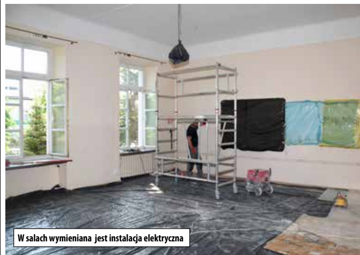
W salach wymieniana jest instalacja elektryczna