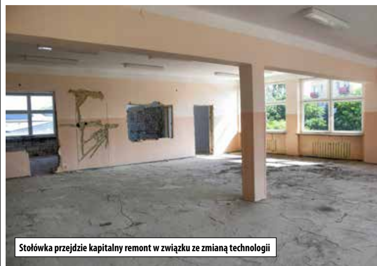
Stołówka przejdzie kapitalny remont w związku ze zmianą technologii