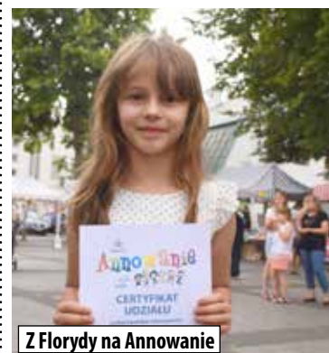
Z Florydy na Annowanie