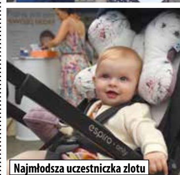
Najmłodsza uczestniczka złota