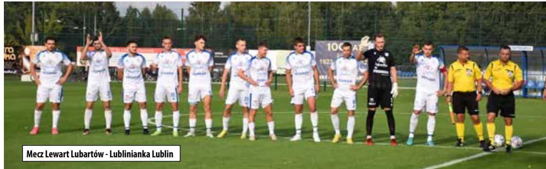
Mecz Lewart Lubartów - Lublinianka Lublin