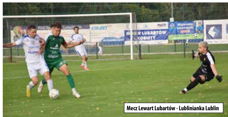
Mecz Lewart Lubartów - Lublinianka Lublin