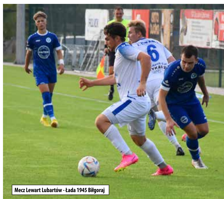
Mecz Lewart Lubartów - Łada 1945 Biłgoraj