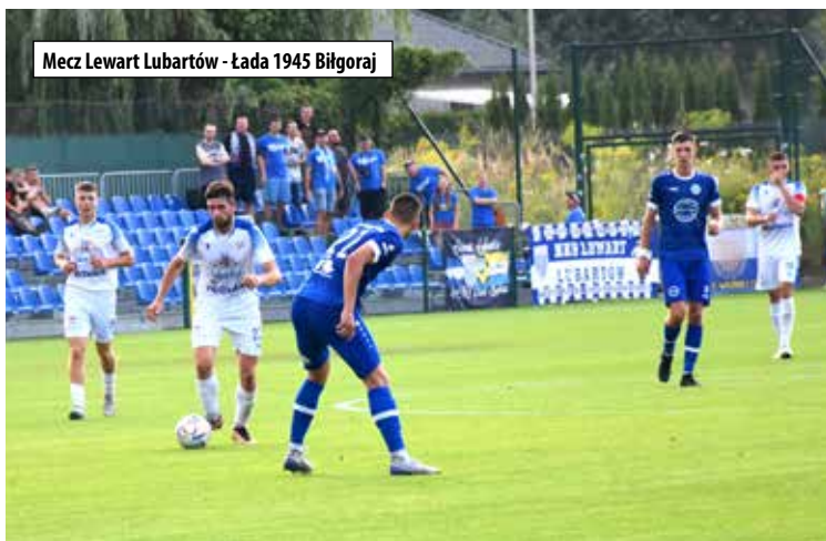
Mecz Lewart Lubartów - Łada 1945 Biłgoraj