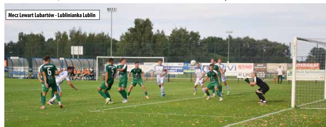
Mecz Lewart Lubartów - Lublinianka Lublin