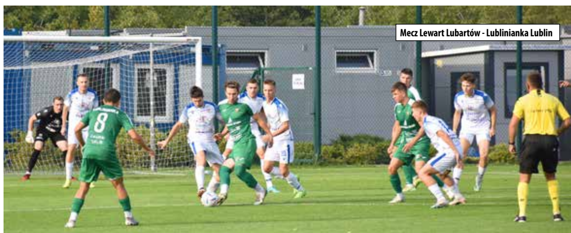
Mecz Lewart Lubartów - Lublinianka Lublin