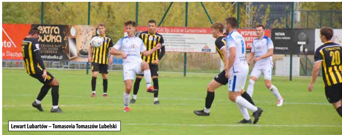
Lewart Lubartów – Tomasovia Tomaszów Lubelski