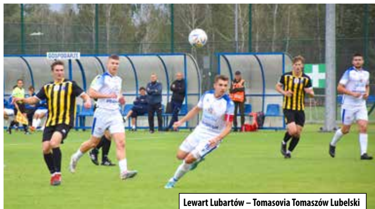
Lewart Lubartów – Tomasovia Tomaszów Lubelski

dziernika. Wtedy to jedenastka z Lubartowa ponownie zagra w roli gospodarza. W niedzielę 29 października o godzinie 12.00 rozpocznie się mecz Lewart Lubartów – Motor II Lublin.