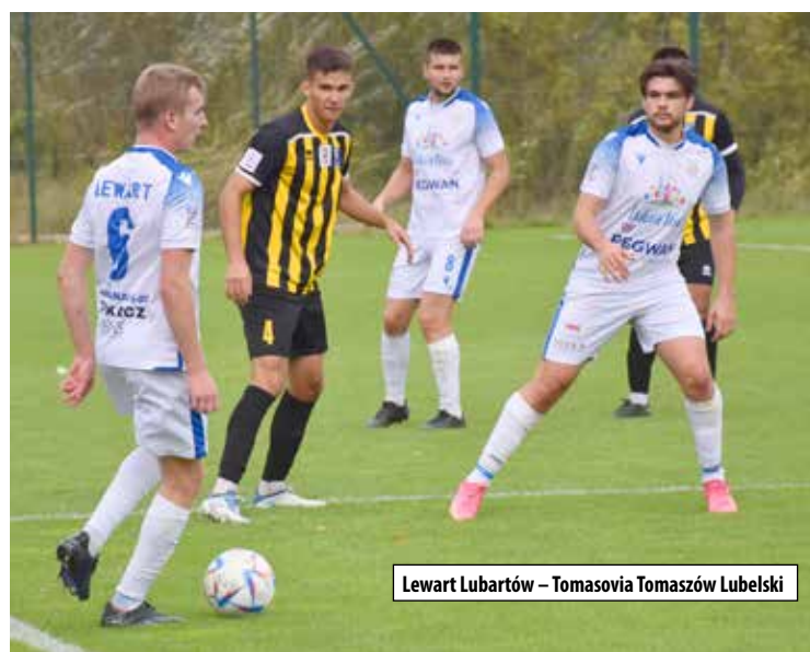
Lewart Lubartów – Tomasovia Tomaszów Lubelski