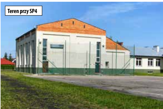
Teren przy SP4

To były emocjonujące rozgrywki szachowe. Szachistka LUKS Lubartów Weronika Dajek w klasyfikacji zawodników do lat 10 zwyciężyła turniej szachowy II FlyingAtom Chess Open, który miał miejsce w dniach 14-15 października w Lublinie.