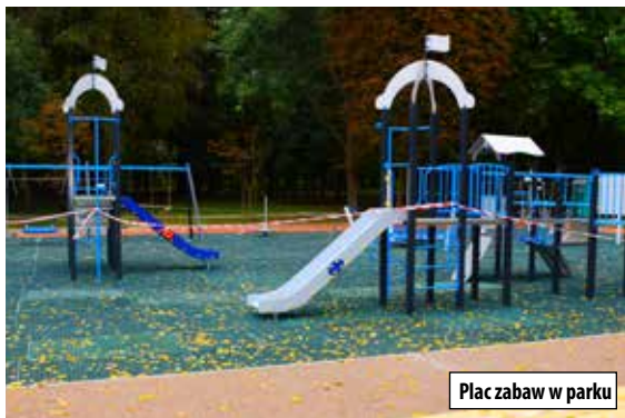
Plac zabaw w parku