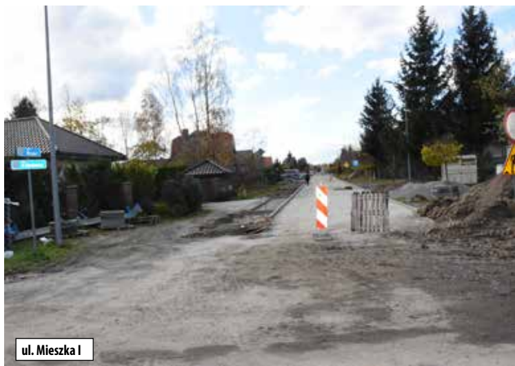
ul. Mieszka I