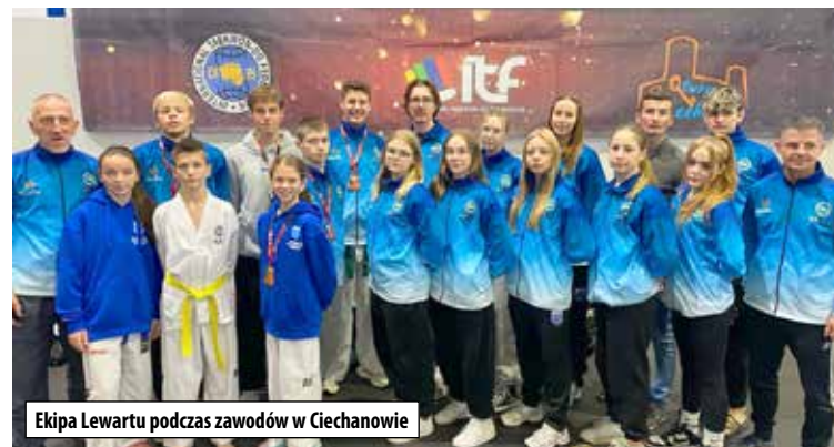
Kolejność zawodników z Lubartowa podczas zawodów w Ciechanowie