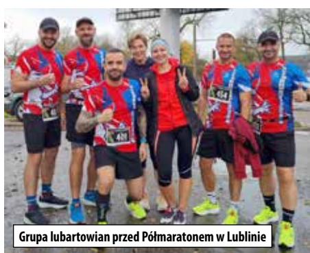
Grupa lubartowian przed Półmaratonem w Lublinie

W sobotę 4 listopada w Lublinie odbył się bieg City Trail. Na dystan-