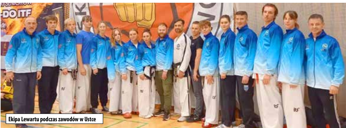
Ekipa Lewartu podczas zawodów w Ustce