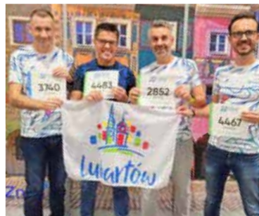
Grupa lubartowian przed Maratonem w Poznaniu