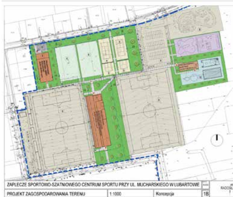
ZAPLECZE SPORTOWO-SZATNIOWEGO CENTRUM SPORTU PRZY UL. MUCHARSKIEGO W LUBARTOWIE PROJEKT ZAGOSPODAROWANIA TERENU 1:1000 Koncepcja 1B

za pomocą formularza dostępnego w Urzędzie Miasta Lubartów lub na stronie www.lubartow.pl Wypełniony dokument można składać: elektronicznie na adres e-mail: poczta@umlubartow.pl lub na adres skrytki ePUPAP lub osobiście lub pocztą tradycyjną na adres urzędu, ul. Jana Pawła II 12, 21-100 Lubartów. Równoległe konsultacje prowadzone są również ze środowiskami sportowymi Miasta Lubartów. Red.