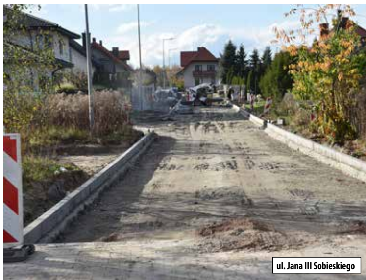
ul. Jana III Sobieskiego