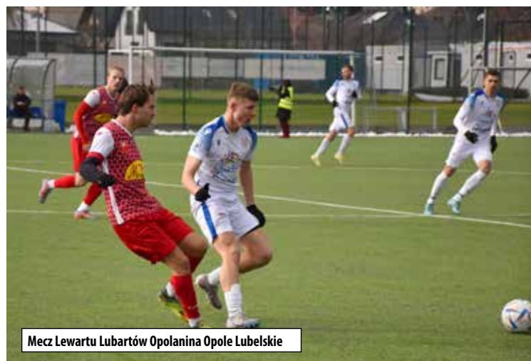
Mecz Lewartu Lubartów Opolanina Opole Lubelskie