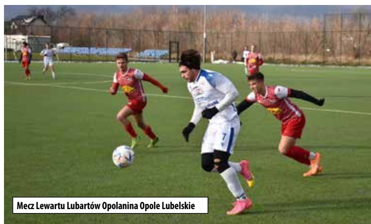
Mecz Lewartu Lubartów Opolanina Opole Lubelskie