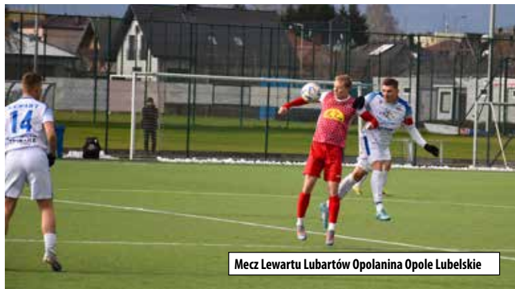
Mecz Lewartu Lubartów Opolanina Opole Lubelskie

Ostatnie spotkanie rundy jesiennej listopada w Opolu Lubelskim. Wte- miało się odbyć w weekend 18/19 dy plany pokrzyżowała pogoda.