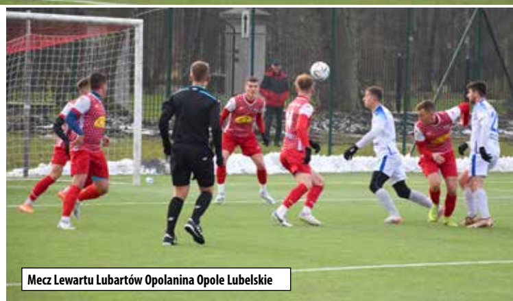
Mecz Lewartu Lubartów Opolanina Opole Lubelskie