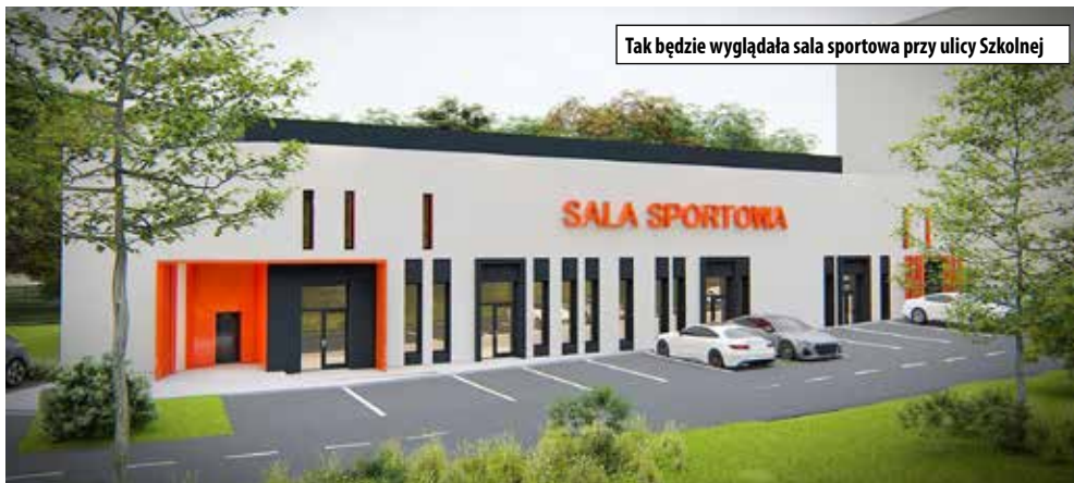
Tak będzie wyglądała sala sportowa przy ulicy Szkolnej

- W tym budżecie znalazły się te pozycje, o które walczyliśmy przez wiele lat. Moim celem było dofinansowanie oświaty pod względem inwestycyjnym – mówił.