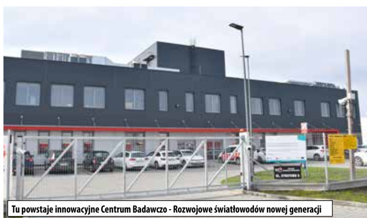
Tu powstaje innowacyjne Centrum Badawczo - Rozwojowe światłowodów nowej generacji

Wszystkie tereny przyłączone do Specjalnej Strefy Ekonomicznej Euro – Park Mielec znalazły nabywców w ciągu 10 lat od jej powstania. Oprócz tego zagospodarowanych zostało ponad 13,8 ha gruntów nabytych przez Miasto sąsiadujących ze strefą, zlokalizowanych po obu stronach ulicy Strefowej. Łącznie przedsiębiorcy zakupili pod prowadzoną działalność od Miasta ponad 33,6 ha te-