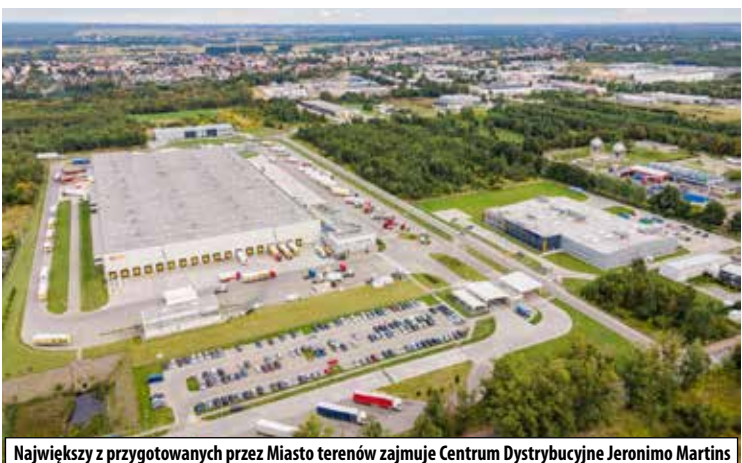
Największy z przygotowanych przez Miasto terenów zajmuje Centrum Dystrybucyjne Jeronimo Martins

Strefa Ekonomiczna w Lubartowie, czyli jakie firmy postawiły na swój dalszy rozwój na terenach przy ulicy Strefowej?