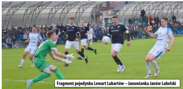
Fragment pojedynku Lewart Lubartów – Janowianka Janów Lubelski