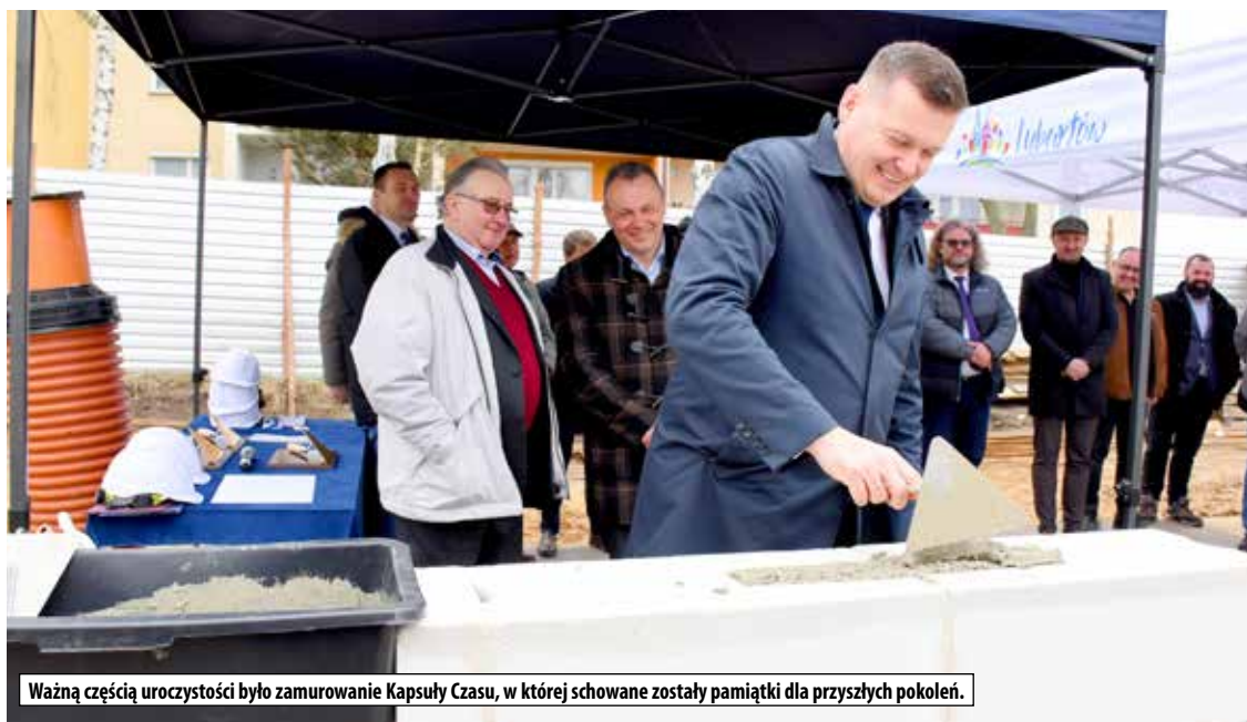
Ważną częścią uroczystości było zamurowanie Kapsuły Czasu, w której schowane zostały pamiątki dla przyszłych pokoleń.