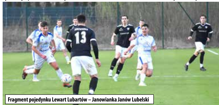
Fragment pojedynku Lewart Lubartów – Janowianka Janów Lubelski

W najbliższą sobotę 13 kwietnia, w ramach dwudziestej drugiej kolejki piłkarze Lewartu zagrają na wyjeździe z Lublinianką Lublin. Początek spotkania o godzinie 14.00. Dwudziesta trzecia kolejka zaplanowana jest na środę 17 kwietnia. Wtedy to jedenastka z Lubartowa zagra na własnym boisku ze Startem 1944 Krasnystaw. Mecz rozpocznie się o godzinie 17.00. Następnie w niedzielę 21 kwietnia czeka lubartowian wyjazdowa potyczka ze Stalą Poniatowa.