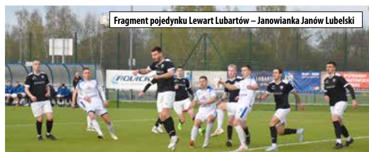
Fragment pojedynku Lewart Lubartów – Janowianka Janów Lubelski