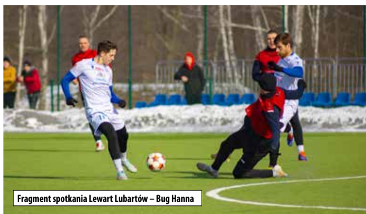
Fragment spotkania Lewart Lubartów – Bug Hanna