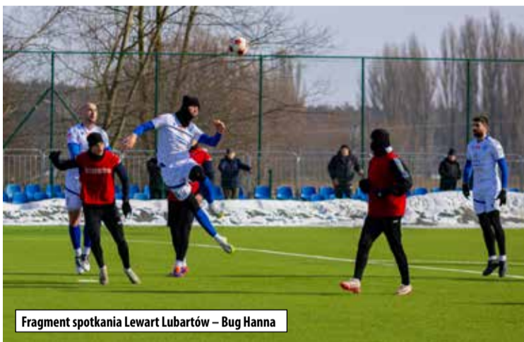
Fragment spotkania Lewart Lubartów – Bug Hanna