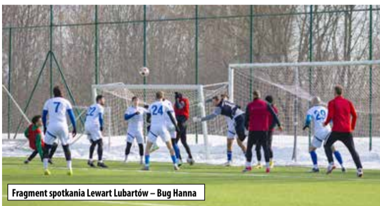
Fragment spotkania Lewart Lubartów – Bug Hanna