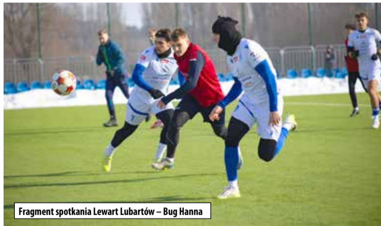
Fragment spotkania Lewart Lubartów – Bug Hanna