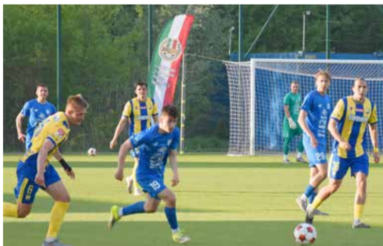
Fragment pojedynku Lewart Lubartów - Avia Świdnik