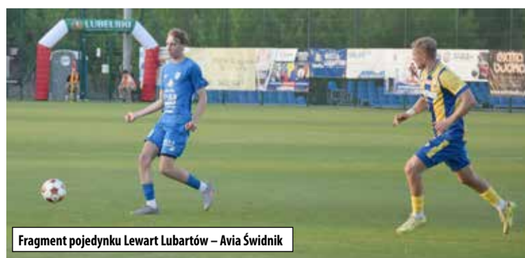
Fragment pojedynku Lewart Lubartów - Avia Świdnik

dzenie. Po kolejnych trzech minutach było już 0:2 i było jasne, kto wygra ten mecz. Ostatecznie Avia Świdnik wygrała 2:0 i zdobyła Puchar Polski Lubelskiego Związ-