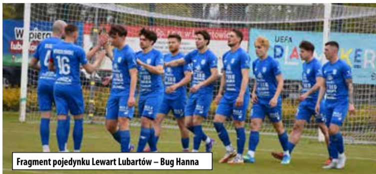
Fragment pojedynku Lewart Lubartów – Bug Hanna