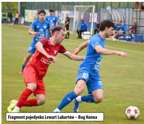
Fragment pojedynku Lewart Lubartów – Bug Hanna