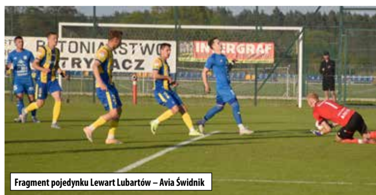
Fragment pojedynku Lewart Lubartów - Avia Świdnik