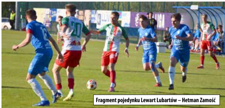
Fragment pojedynku Lewart Lubartów – Hetman Zamość

leży traktować w kategorii dużej niespodzianki, a nawet małej sensacji.