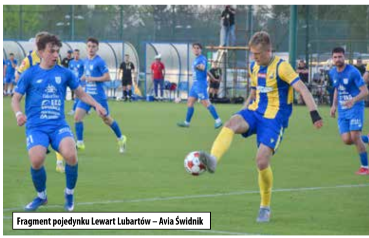
Fragment pojedynku Lewart Lubartów - Avia Świdnik