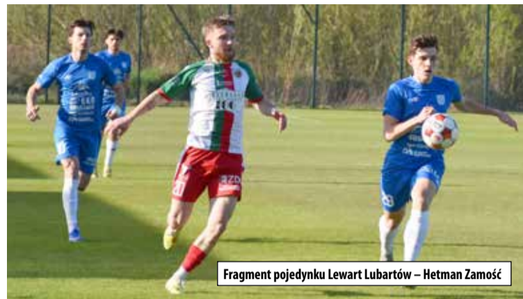
Fragment pojedynku Lewart Lubartów – Hetman Zamość