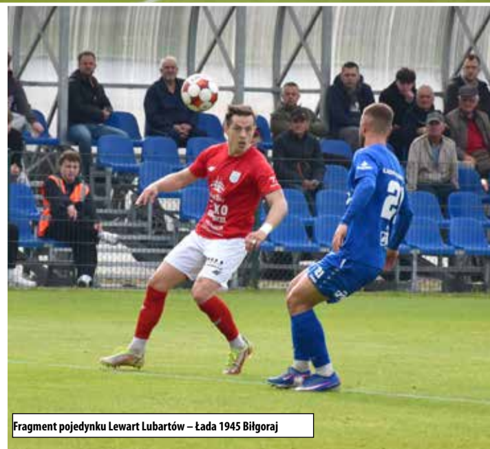
Fragment pojedynku Lewart Lubartów – Łada 1945 Biłgoraj