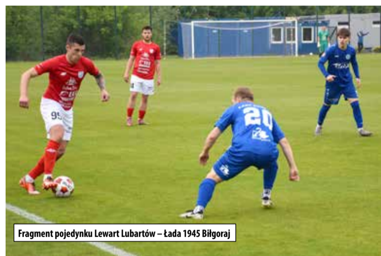
Fragment pojedynku Lewart Lubartów – Łada 1945 Biłgoraj

Ładą 1945 Biłgoraj dają względne bezpieczeństwo. Wydaje się, że zajęcie drugiego miejsca na koniec sezonu jest bardzo realne. A to da możliwość rywalizacji w barażach o awans do III ligi. W ewentualnym barażowym półfinale Lewart może trafić na jedną z trzech ekip IV ligi małopolskiej – Wiczystrą II Kraków, Beskid Andrychów lub Orła Ryczów.