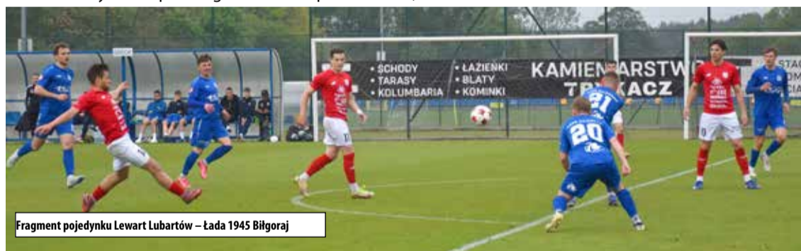
Fragment pojedynku Lewart Lubartów – Łada 1945 Biłgoraj

Do zakończenia sezonu pozostały do rozegrania trzy serie spotkań. Aktualnie Lewart traci do lidera pięć punktów oraz ma przewagę czterech punktów nad trzecią ekipą. Trudno będzie już zagrozić liderującemu Hetmanowi Zamość. Z kolei cztery oczka przewagi nad