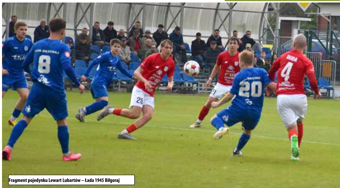
Fragment pojedynku Lewart Lubartów – Łada 1945 Biłgoraj