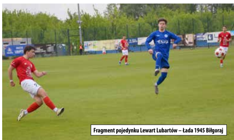
Fragment pojedynku Lewart Lubartów – Łada 1945 Biłgoraj