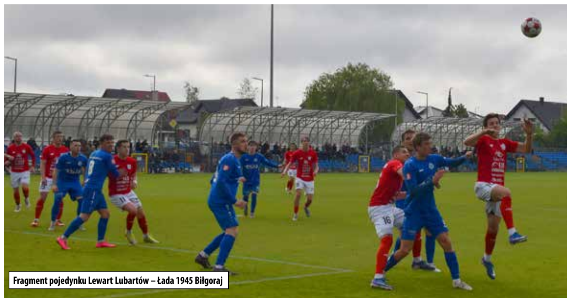
Fragment pojedynku Lewart Lubartów – Łada 1945 Biłgoraj

Dwa kolejne spotkania rundy wiosennej w rozgrywkach Macron IV ligi lubelskiej w sezonie 2025/2026 mają za sobą piłkarze Lewartu Lubartów. Podopieczni Grzegorza Bonina zdobyli w dwóch spotkaniach na własnym boisku trzy punkty. Jedenastka z Lubartowa przegrała 0:1 z Ładą 1945 Biłgoraj oraz pokonała Granit Bychawa 5:1. Po dwudziestu siedmiu kolejkach piłkarze z Lubartowa w ligowej tabeli zajmują drugie miejsce. Dotychczas zgromadzili 68 punktów i tracą do lidera 5 punktów. Do zakończenia sezonu pozostały do rozegrania trzy kolejki spotkań.