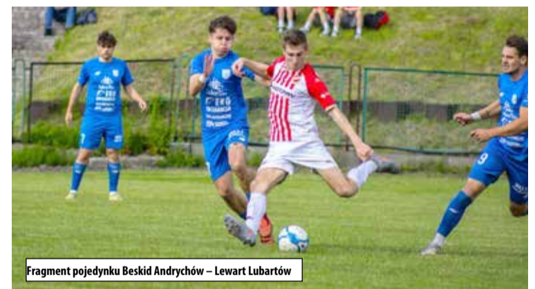
Fragment pojedynku Beskid Andrychów – Lewart Lubartów