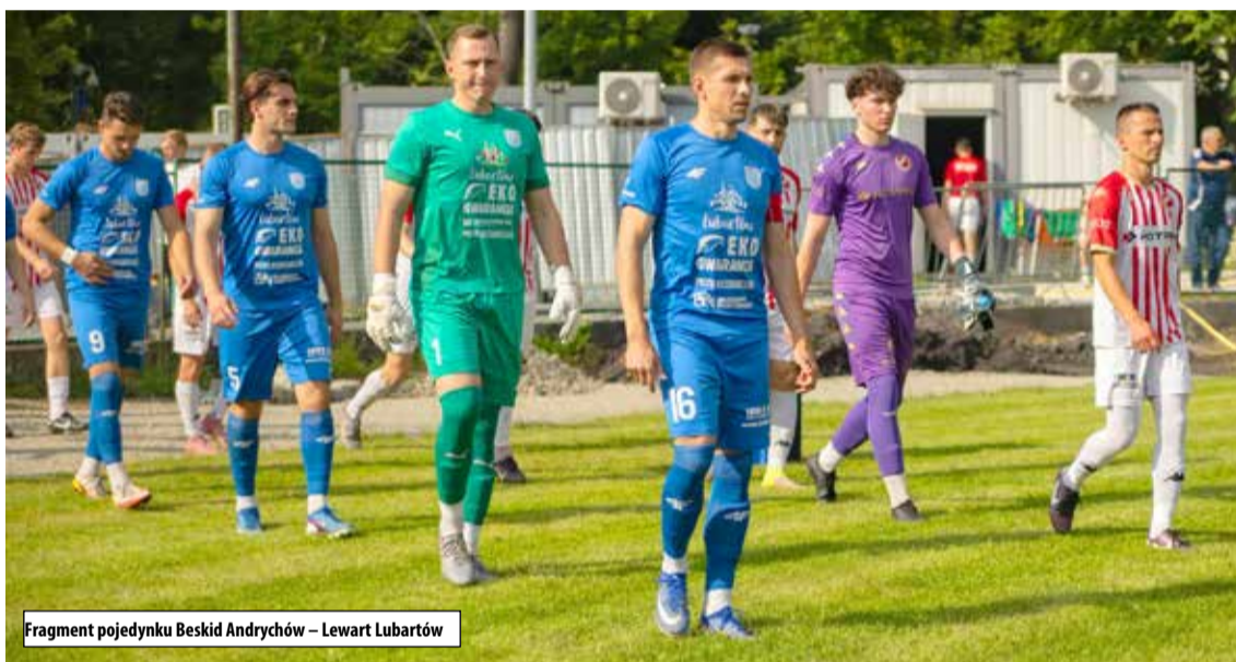
Fragment pojedynku Beskid Andrychów – Lewart Lubartów