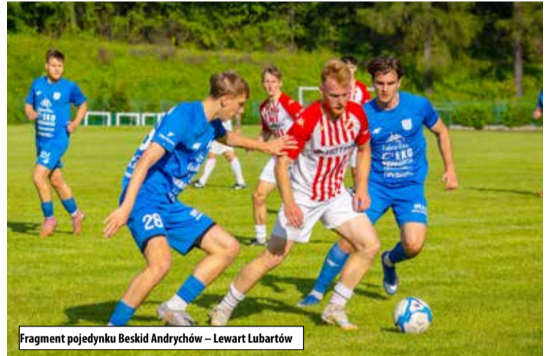
Fragment pojedynku Beskid Andrychów – Lewart Lubartów