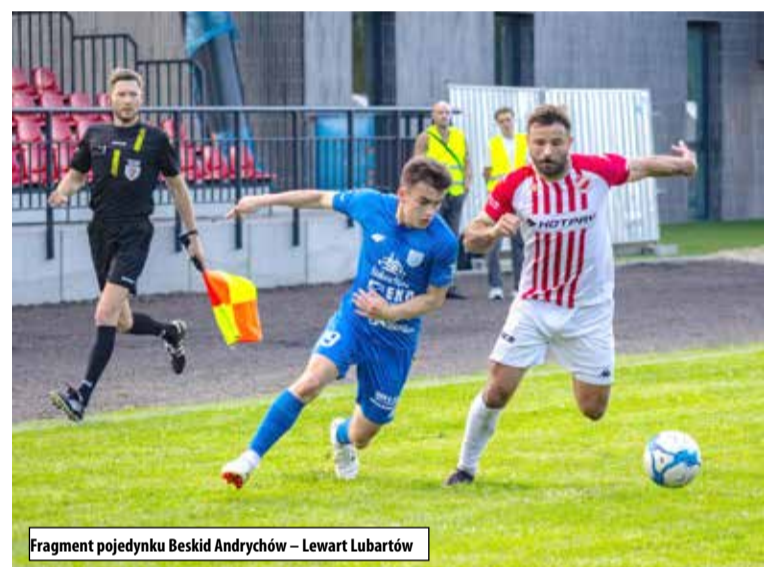
Fragment pojedynku Beskid Andrychów – Lewart Lubartów