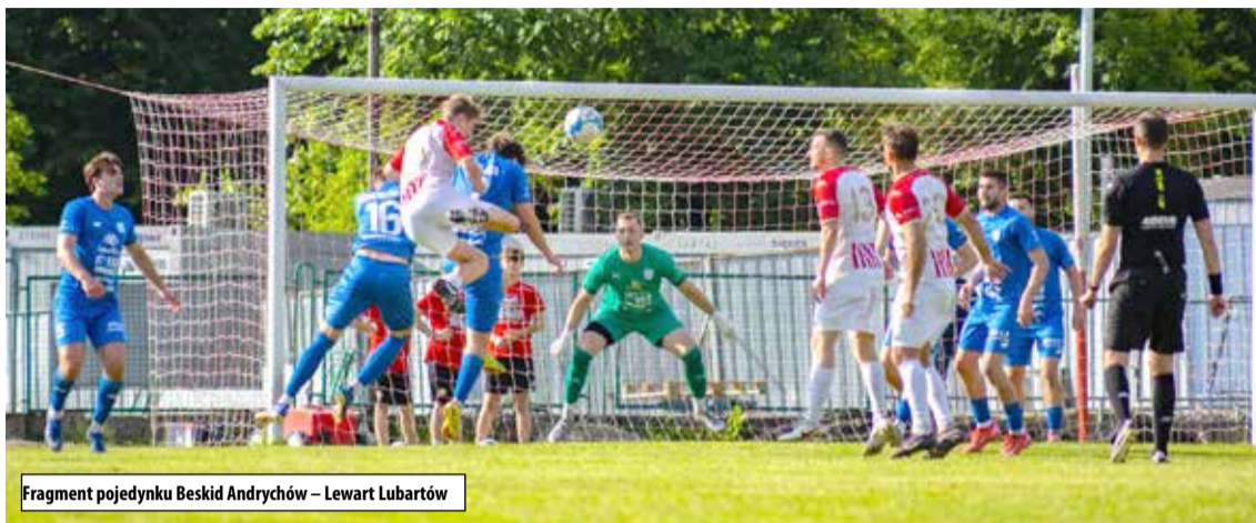
Fragment pojedynku Beskid Andrychów – Lewart Lubartów